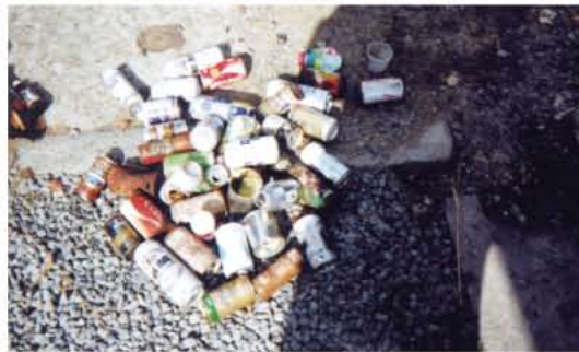
定期<山林巡回>で集めたビンカン