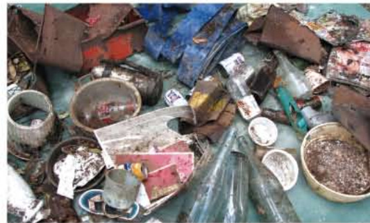
天神町／奥天神町／公園隣接地に投棄されたゴミ