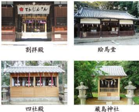
楽しい境内めぐり