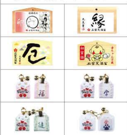
<天神> 授与品頒布所